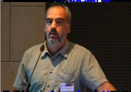
Επίσημο Πρόγραμμα Ολοήμερο Επιστημονικό Σεμινάριο Αθηνών (ΕΚΠΑ)