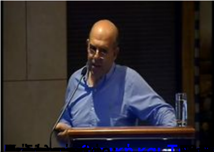
Επίσημο Πρόγραμμα Ολοήμερο Επιστημονικό Σεμινάριο Αθηνών (ΕΚΠΑ)