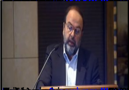
Επίσημο Πρόγραμμα Συμπόσιου Νευροαισθητικής Σχολής Αθηνών (ΕΚΠΑ)