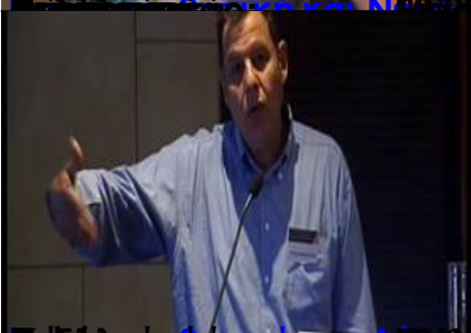
Επίσημο Πρόγραμμα Ολοήμερο επιστημονικό Σεμινάριο Αθηνών (ΕΚΠΑ)