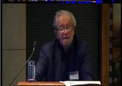
Επίσημο Πρόγραμμα Συμπόσιου Νευροαισθητικής Σχολής Αθηνών (ΕΚΠΑ)