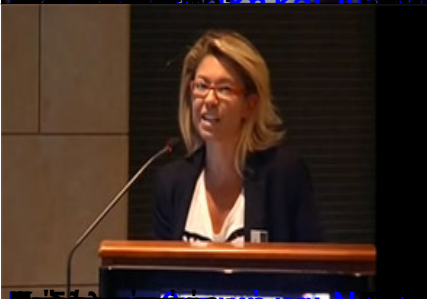
Επίσημο Πρόγραμμα Ολοήμερο Επιστημονικό Σεμινάριο Αθηνών (ΕΚΠΑ)