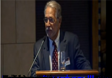
Επίσημο Πρόγραμμα Συμπόσιου Νευροαισθητικής Σχολής Αθηνών (ΕΚΠΑ)