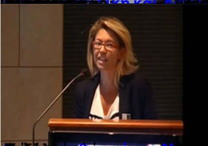
Επίσημο Πρόγραμμα Ολοήμερο επιστημονικό Σεμινάριο Αθηνών (ΕΚΠΑ)