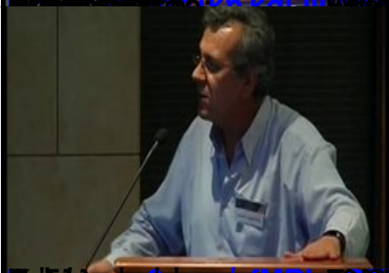
Επίσημο Πρόγραμμα Συμπόσιου Νευροαισθητικής Σχολής Αθηνών (ΕΚΠΑ)