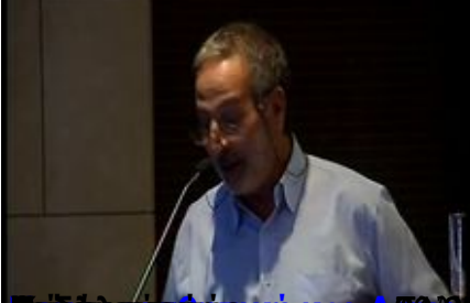
Επίσημο Πρόγραμμα Ολοήμερο επιστημονικό Σεμινάριο Αθηνών (ΕΚΠΑ)