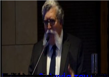
Επίσημο Πρόγραμμα Συμπόσιου Νευροαισθητικής Σχολής Αθηνών (ΕΚΠΑ)