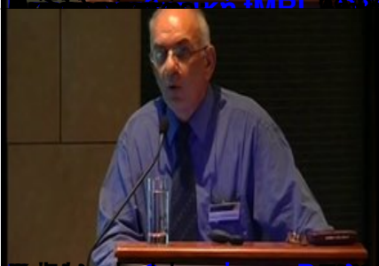
Επίσημο Πρόγραμμα Συμπόσιου Νευροαισθητικής Σχολής Αθηνών (ΕΚΠΑ)