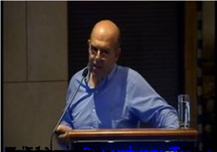
Επίσημο Πρόγραμμα Ολοήμερο επιστημονικό Σεμινάριο Αθηνών (ΕΚΠΑ)