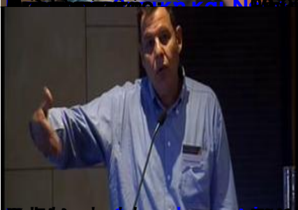
Επίσημο Πρόγραμμα Ολοήμερο Επιστημονικό Σεμινάριο Αθηνών (ΕΚΠΑ)