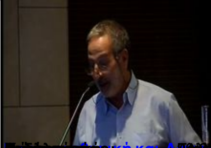
Επίσημο Πρόγραμμα Ολοήμερο Επιστημονικό Σεμινάριο Αθηνών (ΕΚΠΑ)